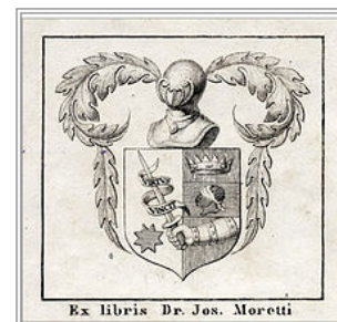
Ex libris di Giuseppe Moretti, 51mmx50mm, 1810

La libreria comprendeva non solo quasi tutte le 50 edizioni in diverse lingue dell'erbario del celebre botanico Pietro Andrea Mattioli , ma anche opere di altri autori anteriori al XVIII secolo, una ricchissima raccolta di testi per lo studio della flora , molte opere monografiche dei primi decenni dell'Ottocento, opuscoli e parecchie importanti pubblicazioni periodiche.