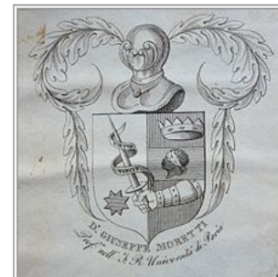
Ex libris di Giuseppe Moretti, 87mmx87mm, 1820